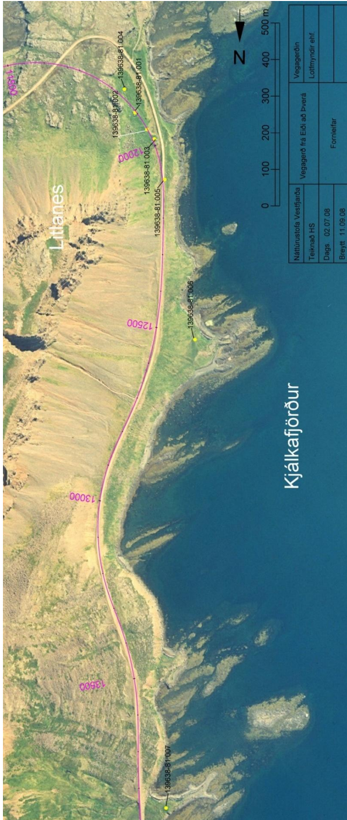
Mynd 3. Minjar við Litlanes og að austan verðu Kjálkafjarðar.