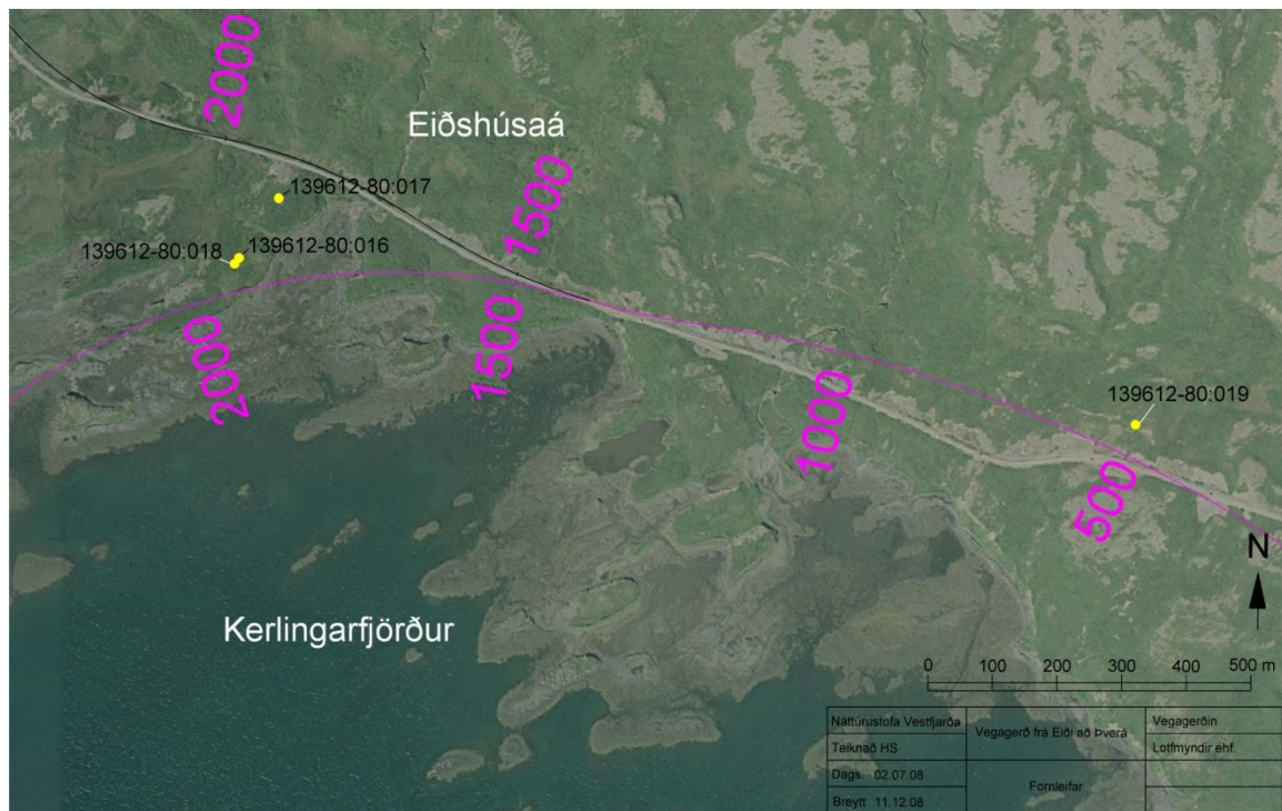
Mynd 1. Minjar í Kerlingarfirði við Eiðshúsaá.

Frá Eiðshúsi að Eiðinu eru skráðir fjórir minjastaðir, varða (139612-80:019), óþekkt tóft (139612-80:017 og 18) og íveruhús (139612-80:016).